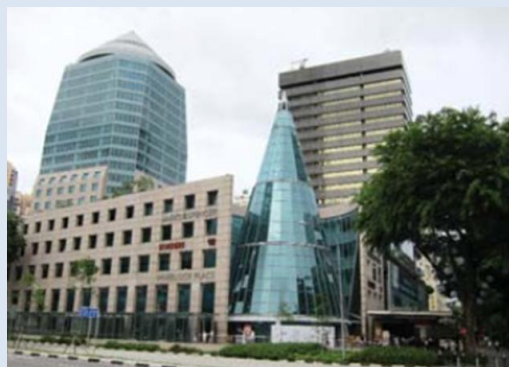
Bureaux SOCAPS ASIA