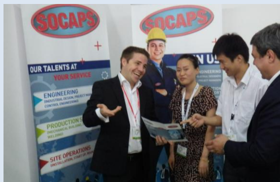
Salon PROPAK CHINA 2012